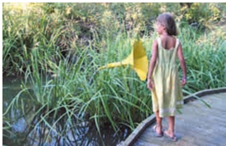
Photo : Les marais du Vigueirat

À PARTIR DE JUIN : exposition sur les paysages et les plantes du delta du Rhône. En calèche, à pied, à vélo et à partir de juin à cheval... Venez découvrir le patrimoine naturel de la Camargue et vous informer sur les pratiques de développement durable.